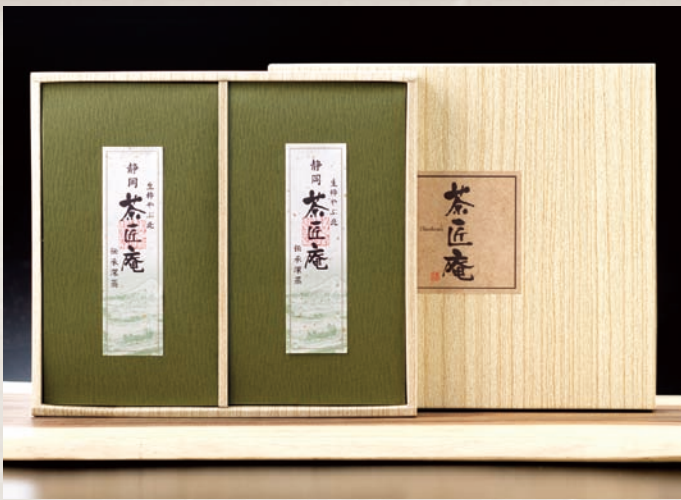
静岡深蒸し銘茶詰合せ ZF-C 3,000円(税別)