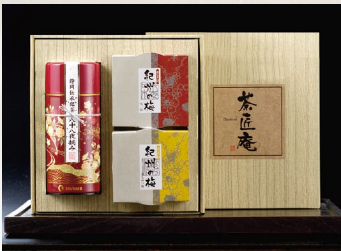
静岡深蒸し銘茶・紀州南高梅詰合せ ZU-CE 3,500円(税別)

内容/上級煎茶(一番摘み)80g・大森屋焼海苔半切10枚入×2 紀州南高梅(味梅)100g・紀州南高梅(はちみつ梅)100g 箱サイズ/346×287×72mm 木目調紙箱・スチール缶