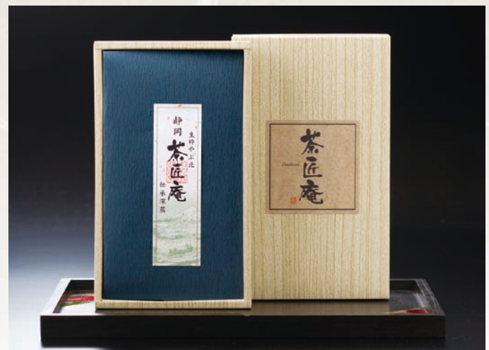
静岡深蒸し銘茶 ZFH-B 2,000円(税別)