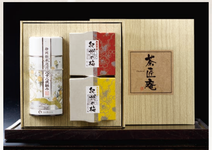
静岡深蒸し銘茶・紀州南高梅詰合せ ZU-C 3,000円(税別)

内容/特上煎茶(八十八夜摘み)110g 紀州南高梅(味梅)100g・紀州南高梅(はちみつ梅)100g 箱サイズ/202×208×72mm 木目調紙箱・スチール缶