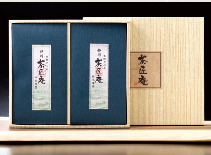
静岡深蒸し銘茶詰合せ ZF-B 2,000円(税別)