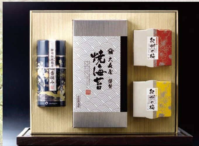
静岡深蒸し銘茶・大森屋焼海苔・紀州南高梅詰合せ ZB-CE 3,500円(税別)

内容/上級煎茶(一番摘み)80g・大森屋焼海苔半切10枚入×2 紀州南高梅(味梅)100g・紀州南高梅(はちみつ梅)100g 箱サイズ/346×287×72mm 木目調紙箱・スチール缶