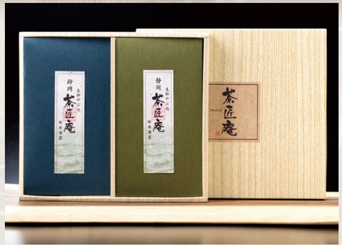
静岡深蒸し銘茶詰合せ ZF-BE 2,500円(税別)